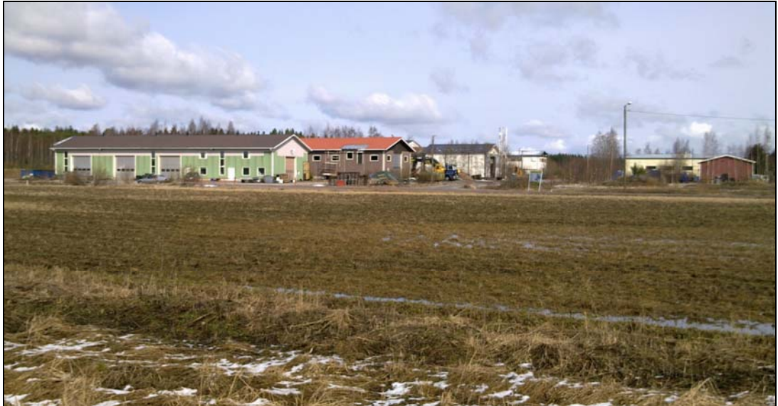
Näkymä alueelle Karviaistentieltä